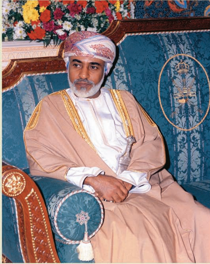
حضرة صاحب الجلالة السلطان قابوس بن سعيد المعظم His Majesty Sultan Qaboos Bin Said